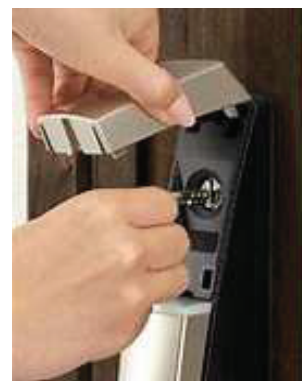
※ YKKap ホームページより画像引用

※電池式も100V式も急な停電や電池切れや故障に備えて、 外出時には常に通常の鍵もお持ち歩いてください。